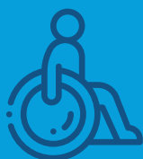
Osobe sa invaliditetom