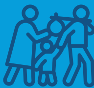
Izbjeglice, tražioci azila i apatridi