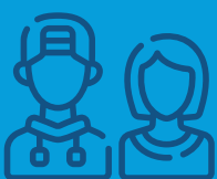
Djeca i mladi